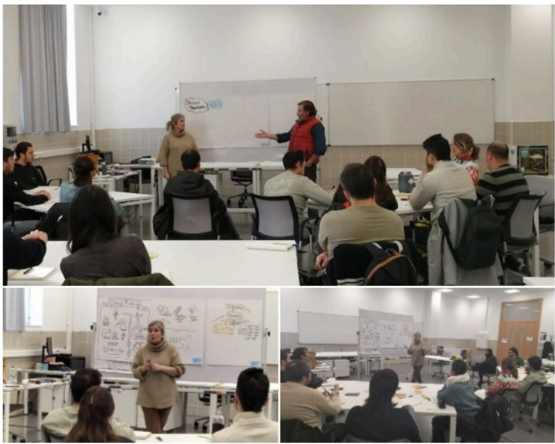
Taller de Design Thinking - UFIL Cuenca

Fase de Diseño y prototipado: La fase 1 se centra en la exploración y definición del problema a partir de una primera aproximación a la bioeconomía forestal y al enfoque innovador que guiará el desarrollo de los proyectos. La sesión se inicia con la bienvenida UFIL-Reconecta y una clase magistral orientada a contextualizar la bioeconomía forestal como marco estratégico de futuro, destacando sus oportunidades, retos y capacidad de transformación territorial. Se celebra en Cuenca uniendo las iniciativas en Soria y Teruel para fomentar el contacto entre las mismas. A continuación, se trabaja con metodologías de innovación mediante Design Thinking. Esto permite a los participantes definir y exponer sus primeras ideas, identificar necesidades reales y estructurar los problemas que desean abordar.