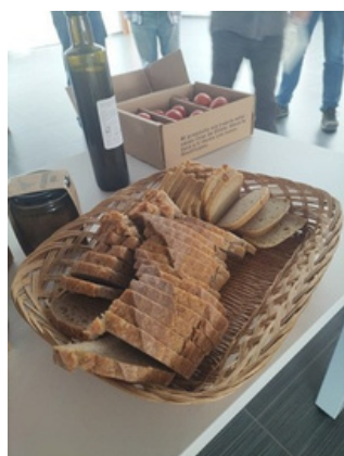
Demoday - Reconecta Teruel