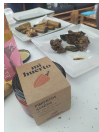
Demoday - Reconecta Teruel