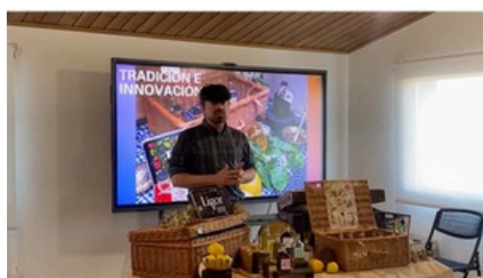
Demoday - Reconecta Soria