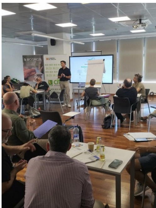
Taller de necesidades no resueltas TERUEL

Fase de Generación de ideas y selección de proyectos: Esta fase pretende acelerar la generación de ideas con proyección. Se realizaron un Taller de Necesidades no Resueltas y un Hackatón , en dos sesiones consecutivas. Estas actividades permiten definir de manera rápida ideas de entre las cuales se definirán cuales iniciarán el proceso de incubación.