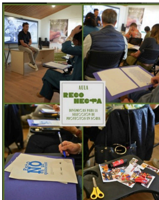
Taller de necesidades no resueltas SORIA