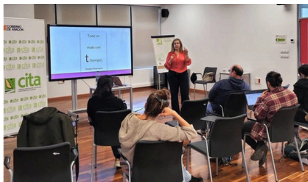
Taller de Validación económico-financiera - ReconectaTeruel

El proceso culmina con un Demoday, donde los proyectos se exponen públicamente, demostrando su madurez técnica, comercial y financiera