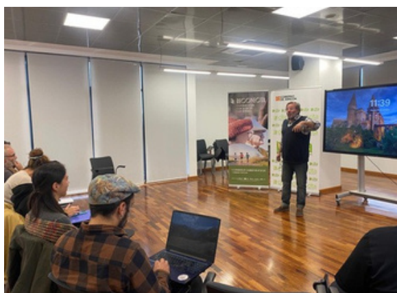
Taller de Comunicación - ReconectaTeruel