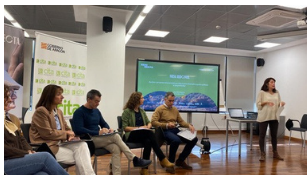
Mesa redonda, Ayuda a emprendedores - ReconectaTeruel